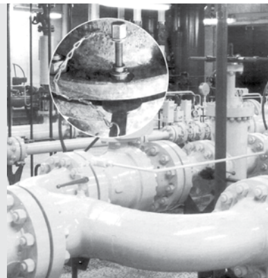
Technische Änderungen vorbehalten