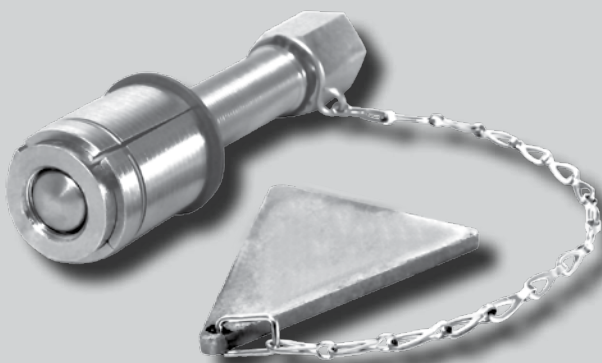
FLANSCH BOY , Made in Germany by alki TECHNIK GmbH